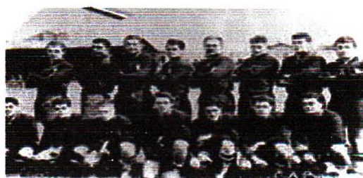
(rang debout 7 è à droite, en 1957) (premier titre national avec le C.A.B)

Né le 10 Mai 1928, Chevalier de la Légion d'honneur, Officier de l'ordre National du Mérite, Officier du Mérite Sportif, Médaille d'or des Joinvillais en 1982; c'était un personnage vraiment hors du commun dans la vie, mais également sur le terrain; un pilier de plus de 100 kg qui courait le 100mètres en 11 secondes.....!